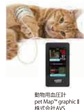
動物用血圧計 pet Map™ graphic II 株式会社AVS